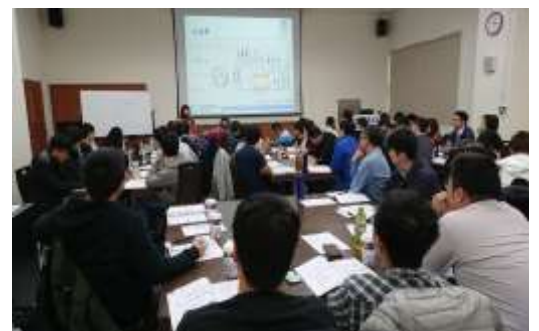
▲上課&圖面討論及演練